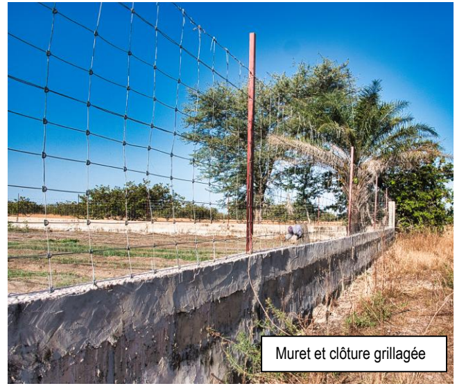
Muret et clôture grillagée