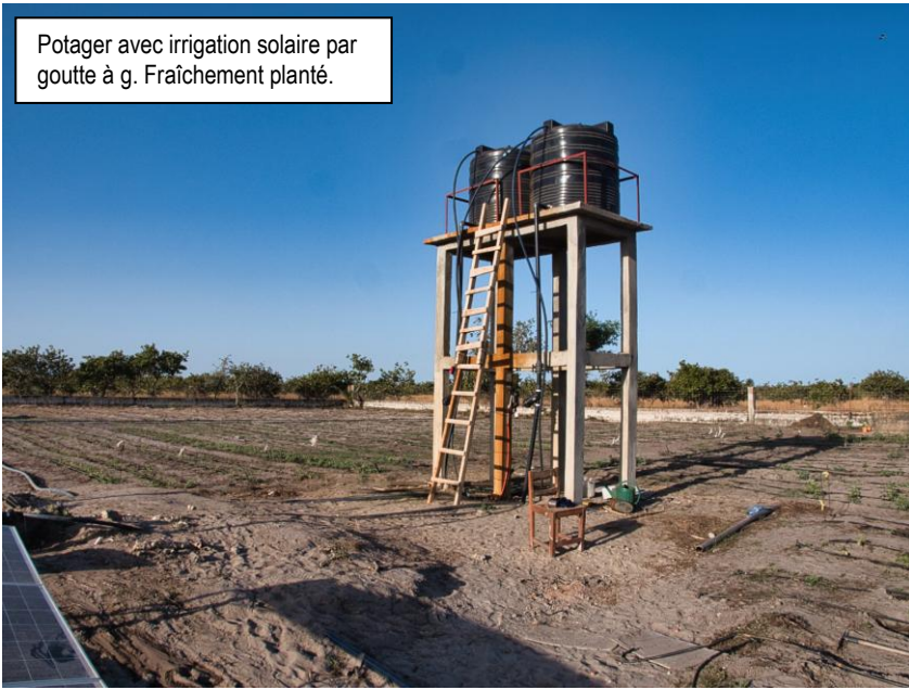
Potager avec irrigation solaire par goutte à g. Fraîchement planté.