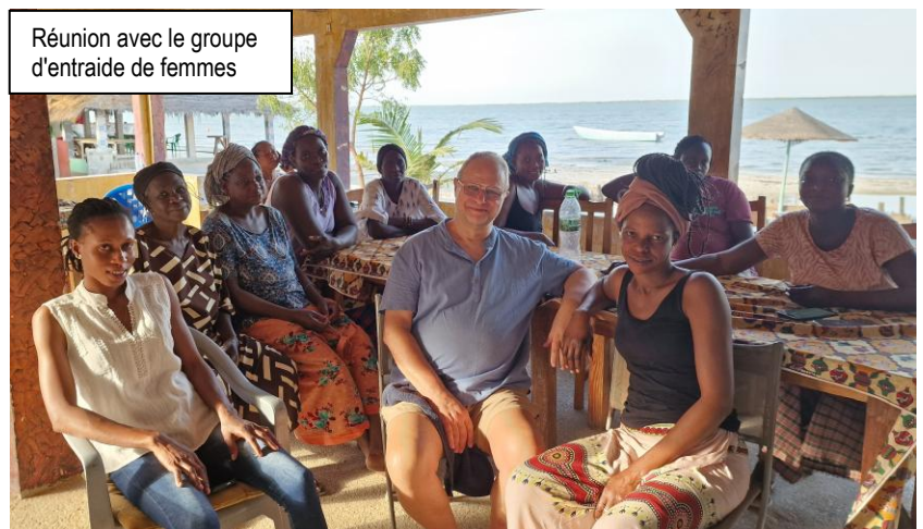
Réunion avec le groupe d'entraide de femmes