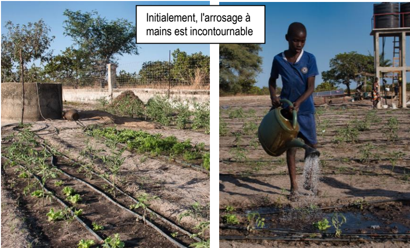
Initialement, l'arrosage à mains est incontournable